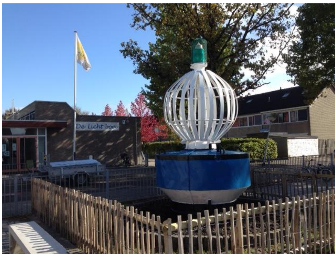
De Lichtboei en de lichtboei zijn er bijna klaar voor!

Wie kunnen er maandagavond 16 oktober even de puntjes op de 'i' zetten in beide gebouwen. Mocht u hierin meedraaien, dan is dat gelijk uw schoonmaakbeurt van dit jaar!