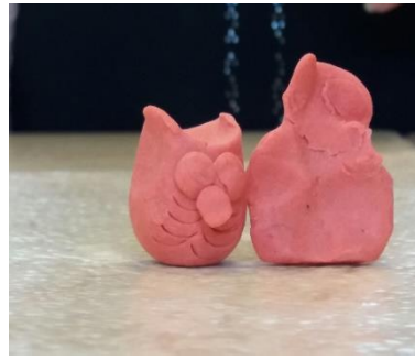
Kleine uil met mama uil!

We hebben het samen fijn! Liefs van de peuters en de juffen van de Ukkenburcht.