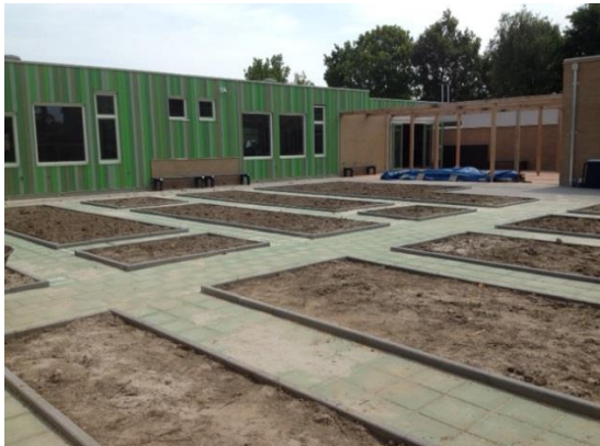
Van nu .....