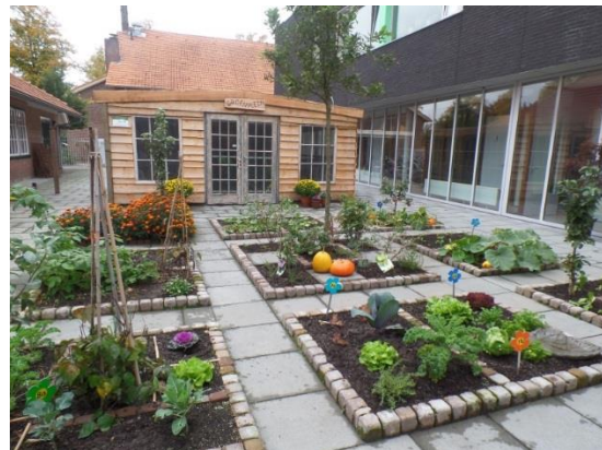
naar zomer 2018!