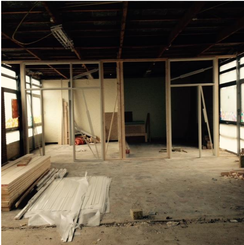
Links de nieuwe teamkamer Rechts de nieuwe IB-ruimte